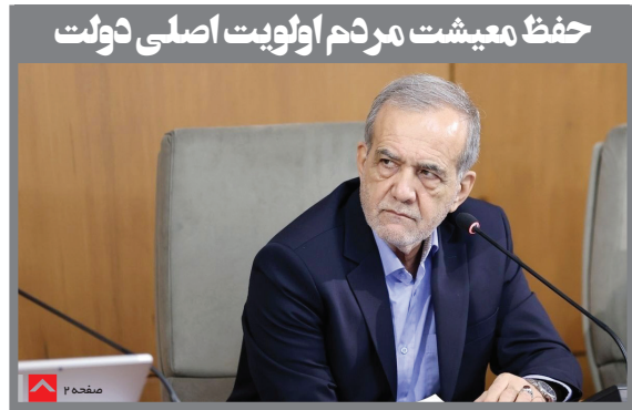
حفظ معیشت مردم اولویت اصلی دولت