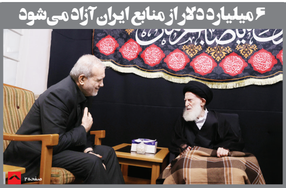
۶ میلیارد دلار از منابع ایران آزاد می شود