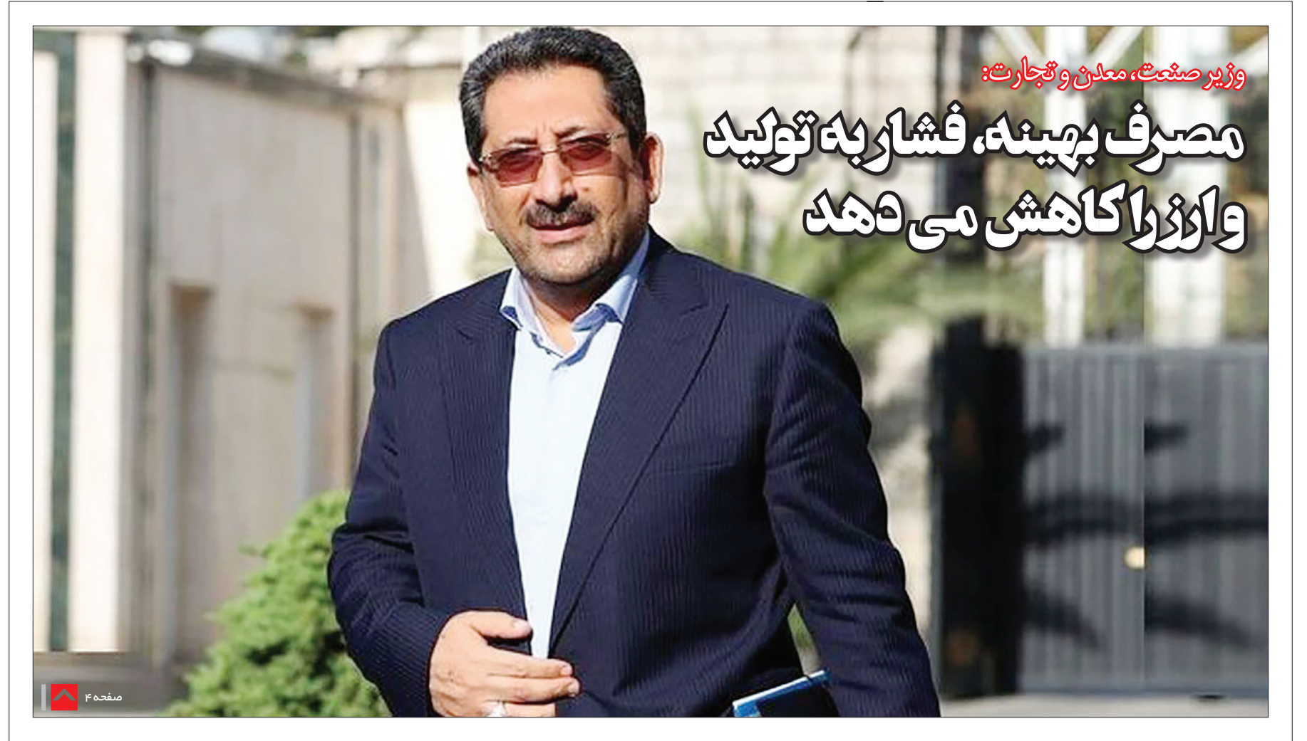
وزیر صنعت، معدن و تجارت: