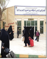
ایستگاه مرزی خسروی

ابتدای خردادماه تا دهم این ماه، مجموعاً ۳۰ هزار و ۵۵۶ نفر از طریق پایانه مرزی خسروی تردد کرده‌اند که از این تعداد، ۱۵ هزار و ۴۹۲ نفر ورودی و ۱۵ هزار و ۴۶ نفر خروجی بوده‌اند.