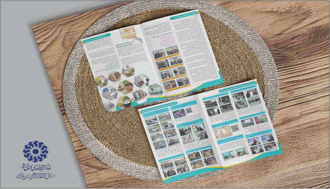
گروه تخصصی پژوهش‌های کتابخانه‌های استان مرکزی

بررسی جامع این گزارش نشان می‌دهد اداره کل کتابخانه‌های عمومی استان مرکزی طی چهار سال گذشته با رویکردی توسعه‌گرا و مبتنی بر بهره‌وری، توانسته است ضمن ارتقای شاخص‌های عملکردی، جایگاه کتابخانه‌ها را به عنوان نهادهای فرهنگی و اجتماعی اثرگذار تثبیت کند. تداوم این روند، به‌ویژه با تکمیل پروژه‌های زیرساختی از جمله کتابخانه مرکزی اراک و تقویت مشارکت‌های مردمی، می‌تواند افق روشنی برای توسعه فرهنگ مطالعه و ارتقای سرمایه اجتماعی در استان مرکزی ترسیم کند.