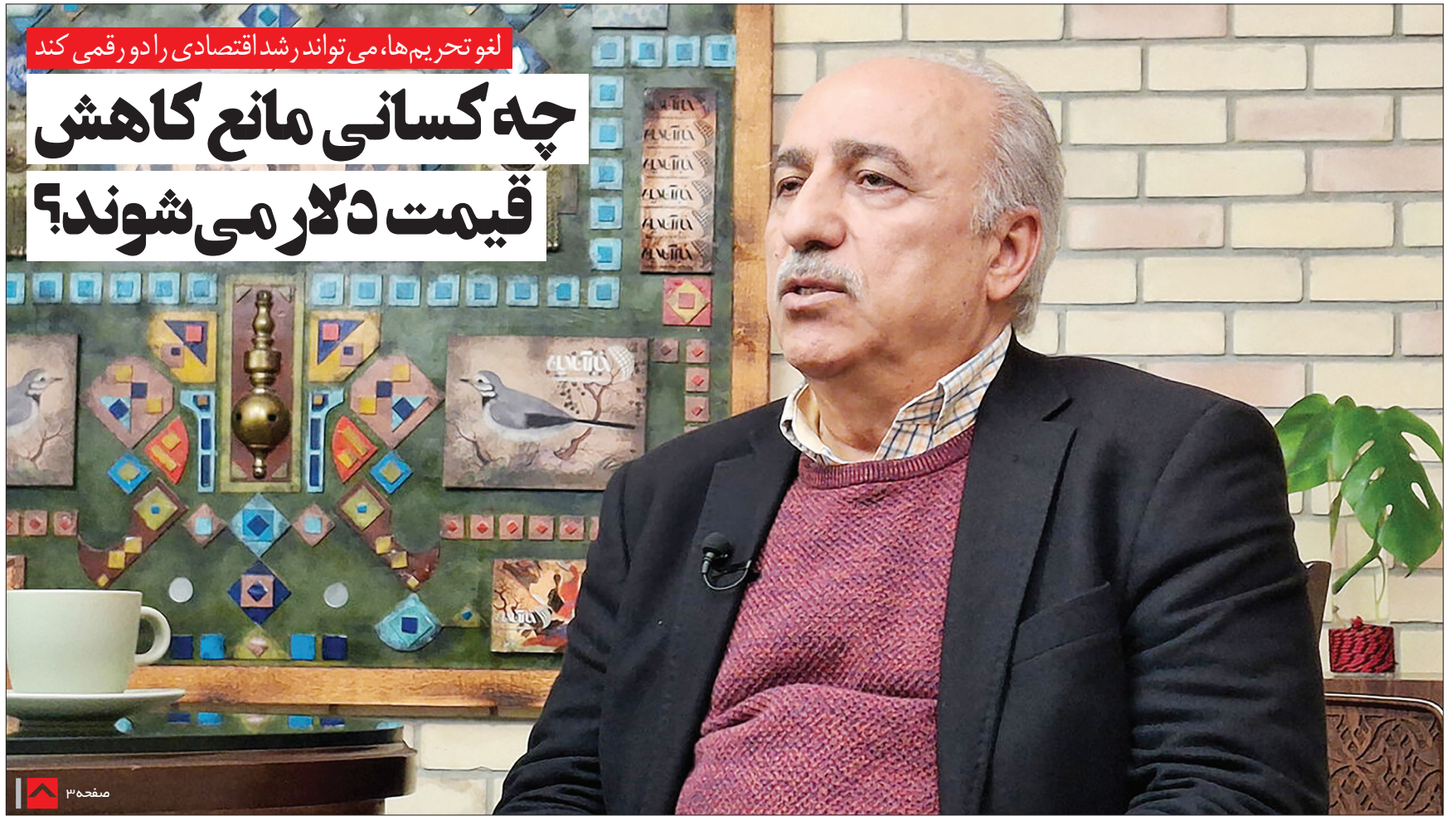
لغو تحریم ها، می تواند رشد اقتصادی را دورقمی کند