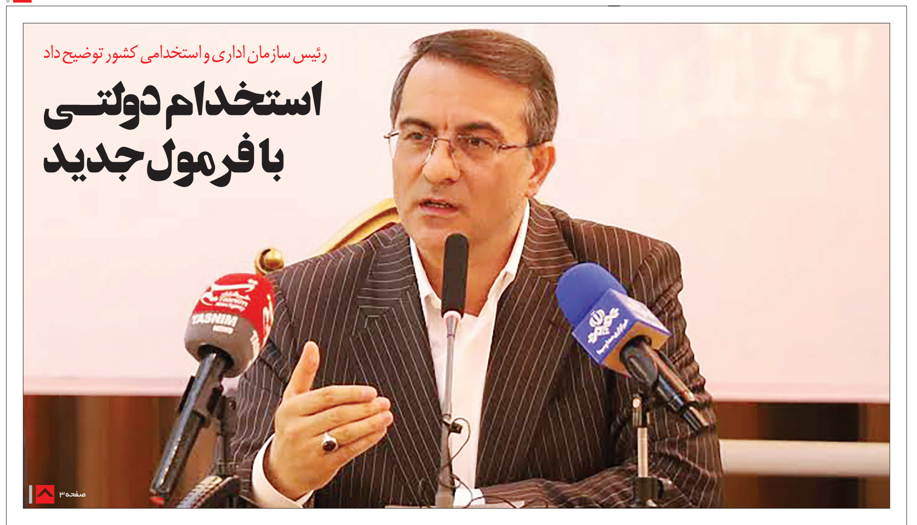
رئیس سازمان اداری و استخدامی کشور توضیح داد