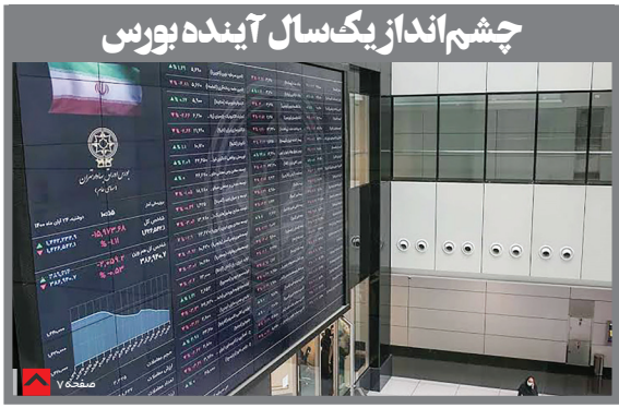
چشم انداز یکسال آینده بورس