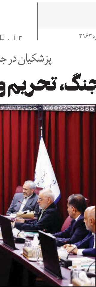
وزیر امور خارجه

مهم تأمین منابع است، اما در کنار آن، مدیریت هزینه‌ها و حذف مصارف غیر ضرور نیز باید به‌صورت جدی در دستور کار قرار گیرد. ضروری است هزینه‌های زائد در دستگاه‌های اجرایی، نهاد‌های دولتی و سایر بخش‌ها شناسایی و کاهش یابد.