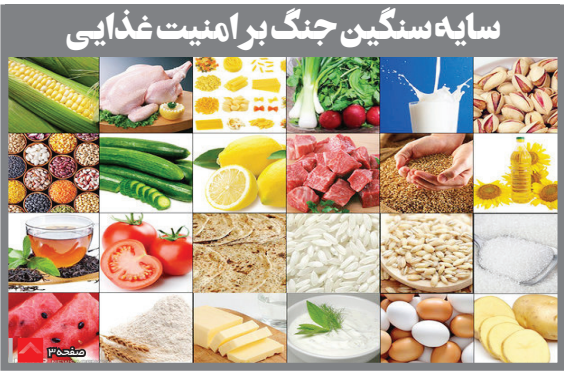
سایه سنگین جنگ بر امنیت غذایی