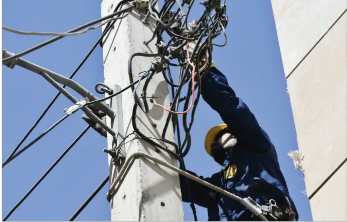
یک مهندس برق در حال کار بر روی تجهیزات در یک مرکز ماینر

خربدار < مدیرعامل شرکت تواینر با تاکید بر اجرای پروژه مدیریت هوشمند تلفات انرژی برق از بر خورد جدی با انشعابات غیر مجاز، دستکاری کنتورها، استفاده غیر متعارف از برق پارانهای و فعالیت ماینرها در واحدهای کشاورزی، صنعتی و دامداری خبر داد و گفت: ماندگاری اقدامات صنعت برق در کاهش تلفات، منوط به اعمال قانون، جمع‌آوری تأسیسات غیر مجاز و پیگیری قضایی تخلفات است.