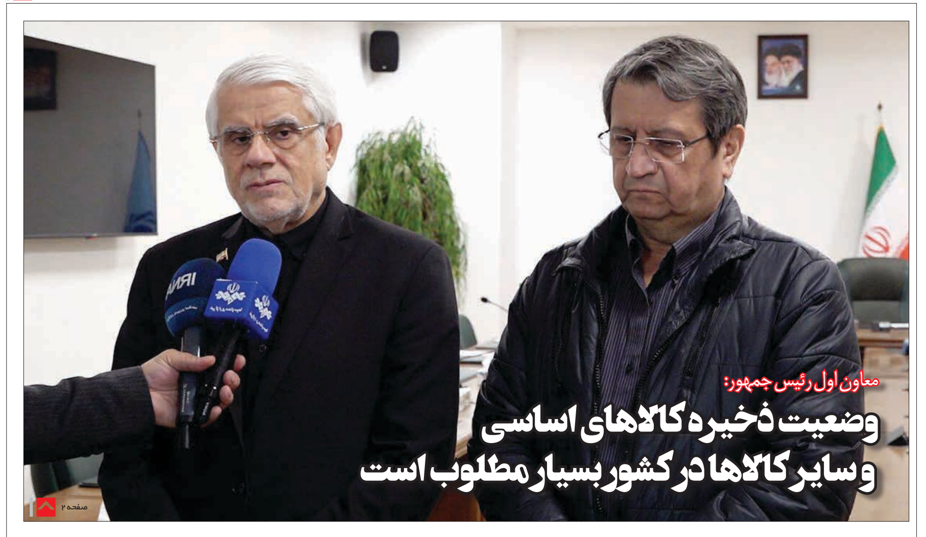
معاون اول رئیس جمهور:

وضعیت ذخیره گالاهای اساسی و سایر گالاهای در کشور بسیار مطلوب است