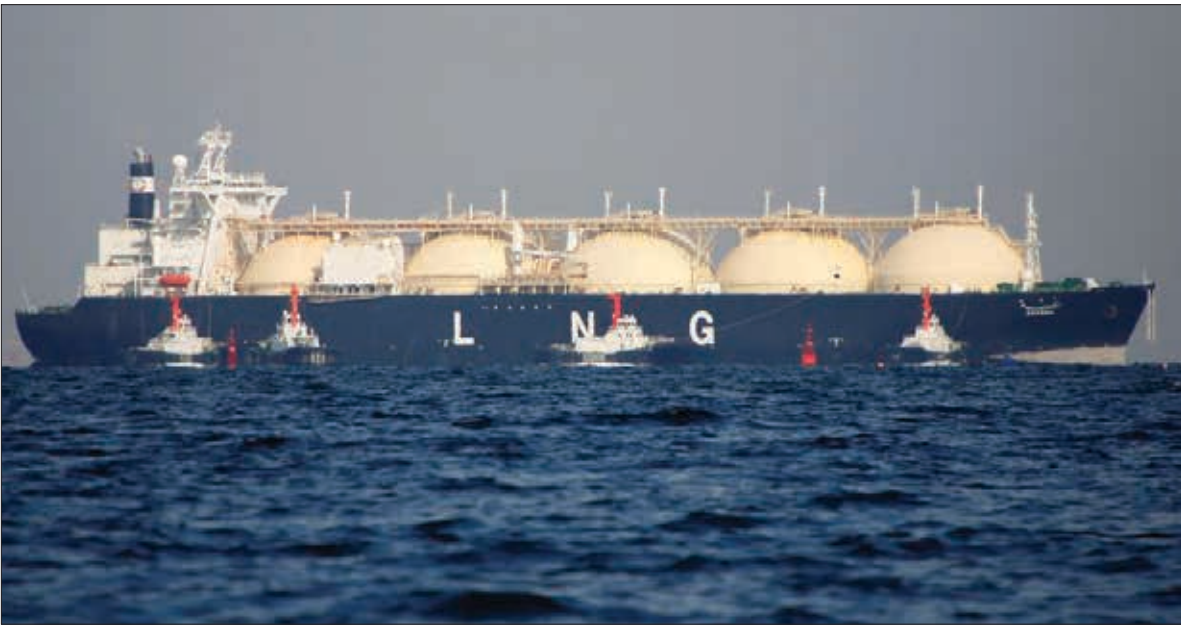
یک کشتی حامل نفت در خلیج فارس

عمق قابلیت کشتیرانی دارد در اختیار هیچ کشوری نیست اما اکنون این محدوده از قوانین بین‌المللی و رژیم حقوقی دریاها بر آن حاکم نیست و هر کسی که قدرت داشته‌باشد می‌تواند فضا را مدیریت کند.