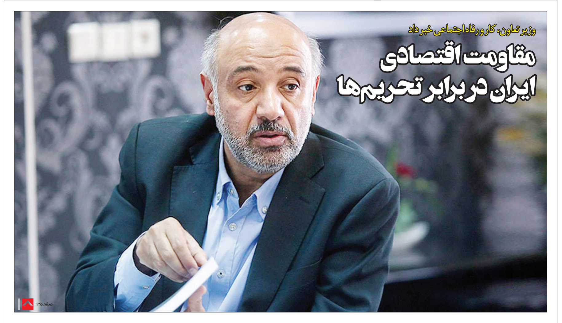
وزیر تعاون، کار و رفاه اجتماعی خبر داد

کروگمن با وجود این هشدارها، به عوامل کاهش‌دهنده آثار بحران نیز اشاره کرد که احتمال توافق برای بازگشایی تنگه، کاهش وابستگی نسبی اقتصاد جهان به نفت نسبت به دهه ۱۹۷۰ و دسترسی به منابع انرژی جایگزین در میان مدت می‌تواند شدت بحران را کاهش دهد.