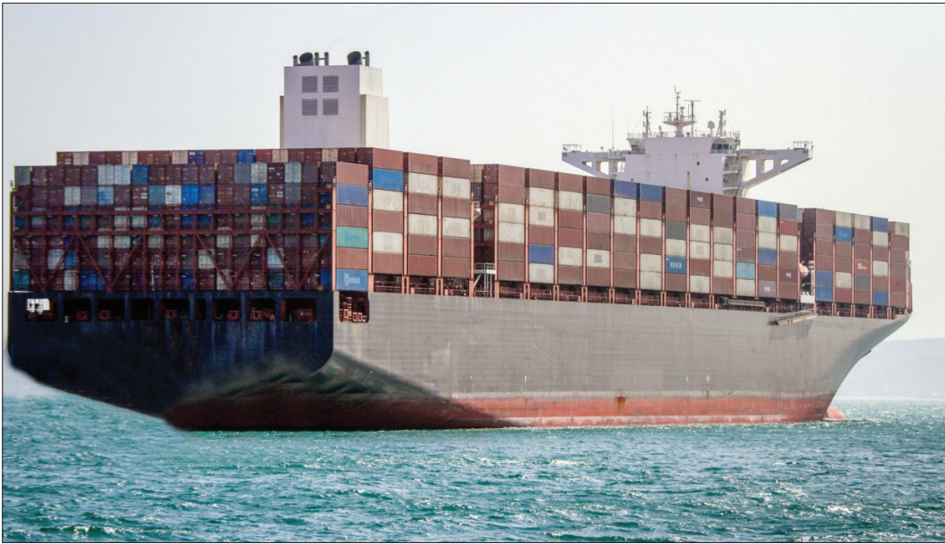
کشتی کانتینر در بندر امام خمینی، تهران، ایران