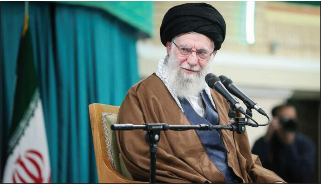
رهبر معظم انقلاب