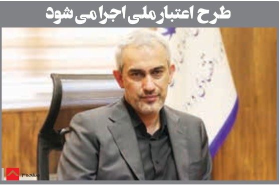
طرح اعتبار ملی اجرا می شود

شهادت حضرت فاطمه زهرا(س) را تسلیت می گوئیم اقتصادی سیاسی اجتماعی فرهنگی ورزشی