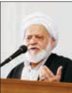
آیت‌الله العظمی خراسانی

بنابراین، از نظر فقهی با پدیده جدیدی در بانک آینده مواجه نبودیم. مصباحی مقدم درباره پرداخت سود بالا و خارج از سودهای شبیکه بانکی در بانک آینده تأکید کرد: این موضوع تخلفات از مقررات بانک مرکزی و مصوبات شورای پول و اعتبار بوده و باید بانک مرکزی به عنوان بانک‌ناظر به هنگام به‌این موضوع ورود می‌کرد و