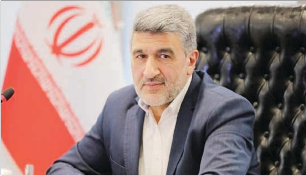
رئیس سازمان بورس

داریم و فعالان بازار افزایش یافته‌اند، ابراز امیدواری کرد که بتوان در این شرایط عرضه‌های اولیه را تقویت کرد زیرا بسیاری تصور می‌کنند بازار سهام فقط بازار ثانویه است؛ در حالی که تشکیل سرمایه واقعی در بازار اولیه صورت می‌گیرد. امیدواریم در بازار اولیه فعال باشیم و سپس پروژه‌ها را از طریق عرضه اولیه در بازار ثانویه در اختیار عموم قرار دهیم.