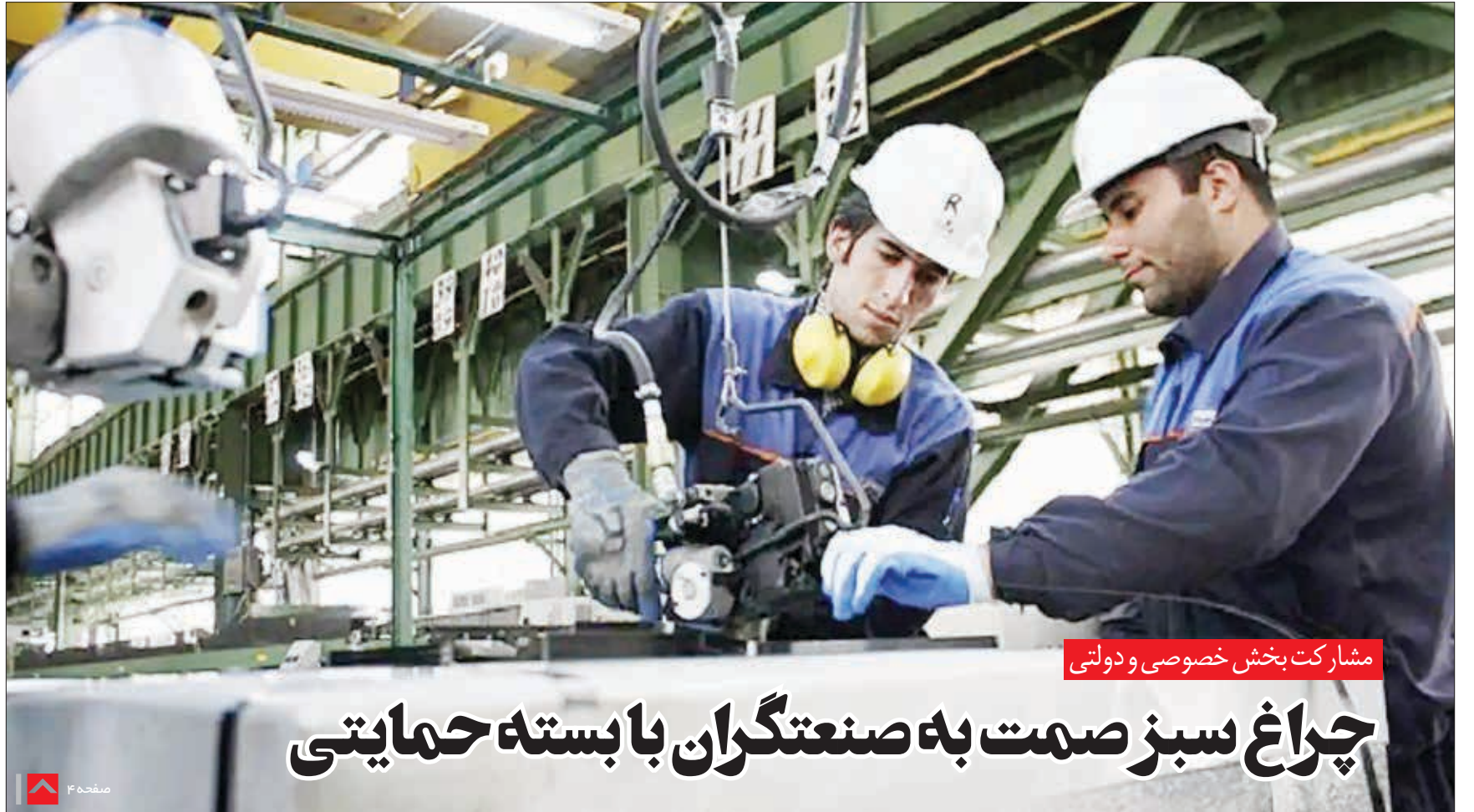
مشارکت بخش خصوصی دولتی