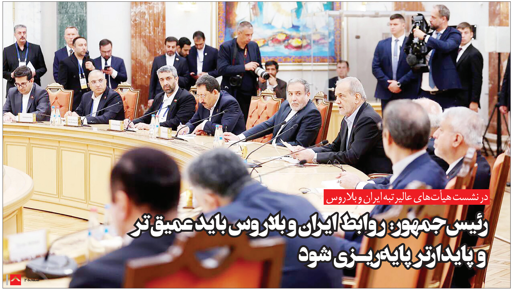
در نشست هیأت های عالی رتبه ایران و بلاروس