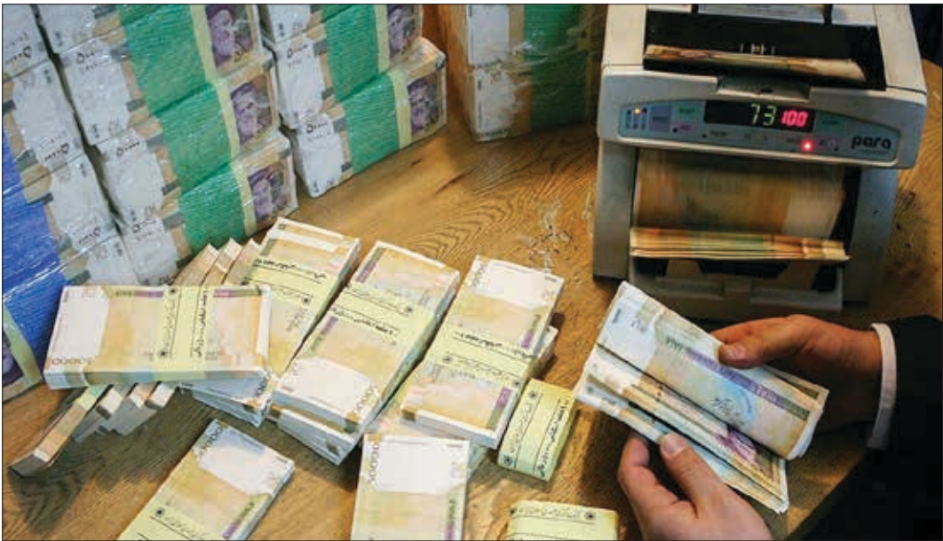
افزایش نقدینگی و تشدید تورم منجر به تورم می‌شود.

نقدینگی نیز در این بازه زمانی به طور مداوم افزایش یافته است. این شاخص که شامل مجموع پول در گردش و سپرده‌های بانکی است، می‌تواند تأثیر مستقیمی بر تورم داشته باشد. به ویژه اگر افزایش آن بیشتر از رشد تولید ناخالص داخلی باشد. افزایش نقدینگی ممکن است به رشد اقتصادی و رونق بازارهای مالی کمک کند، اما اگر میزان آن کنترل نشود، می‌تواند منجر به افزایش سطح عمومی قیمت‌ها و تورم شود.