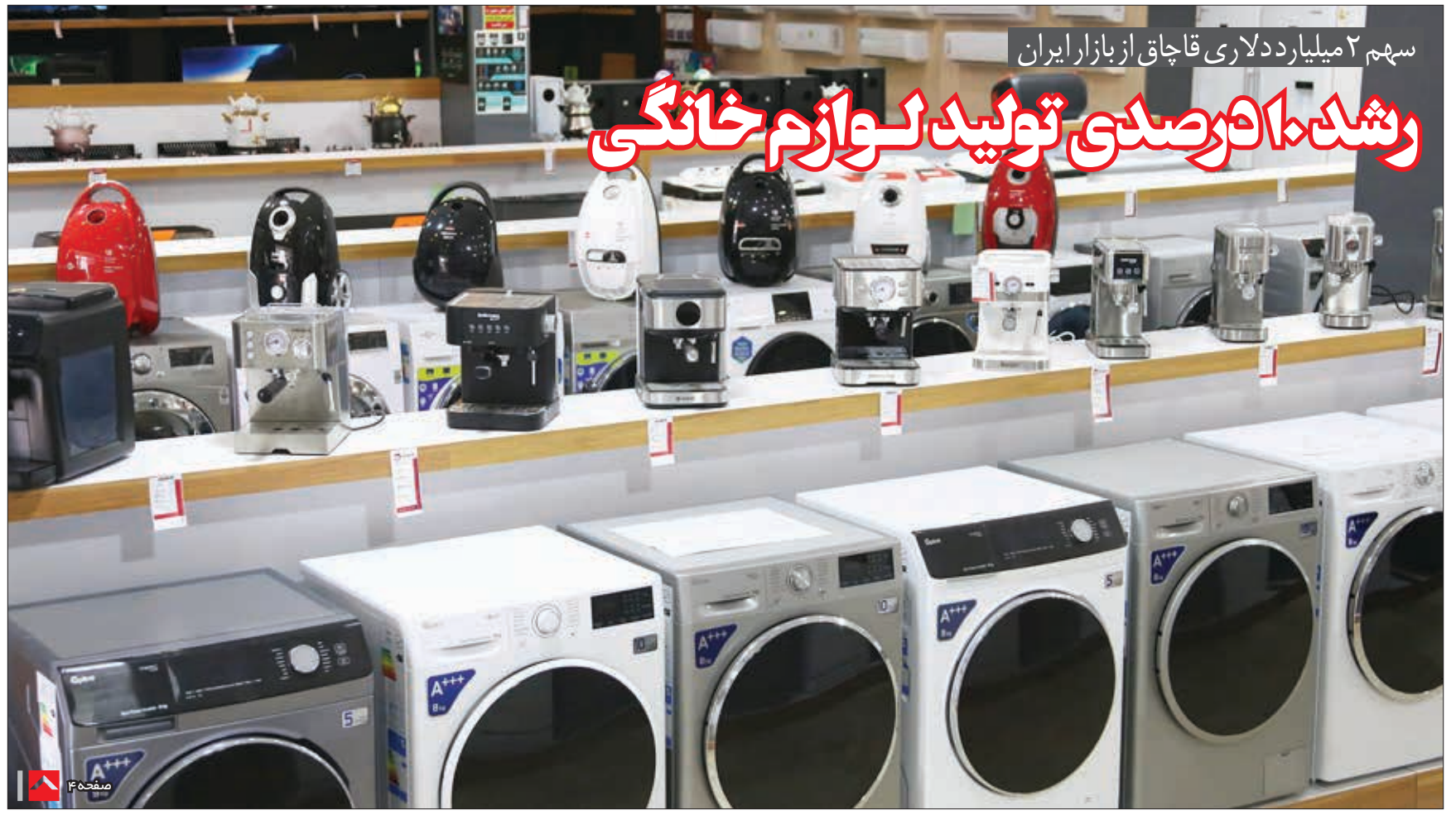
سهام ۲ میلیارد دلاری قاجاق از بازار ایران

وی ادامه داد: افرادی که به میزان مصرفشان از اعتبار انرژی استفاده می‌کنند، می‌توانند مازادش را در بازار عرضه کنند.