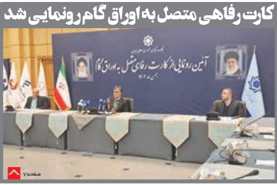
کارت رفاهی متصل به اوراق گامر ونمایی شد