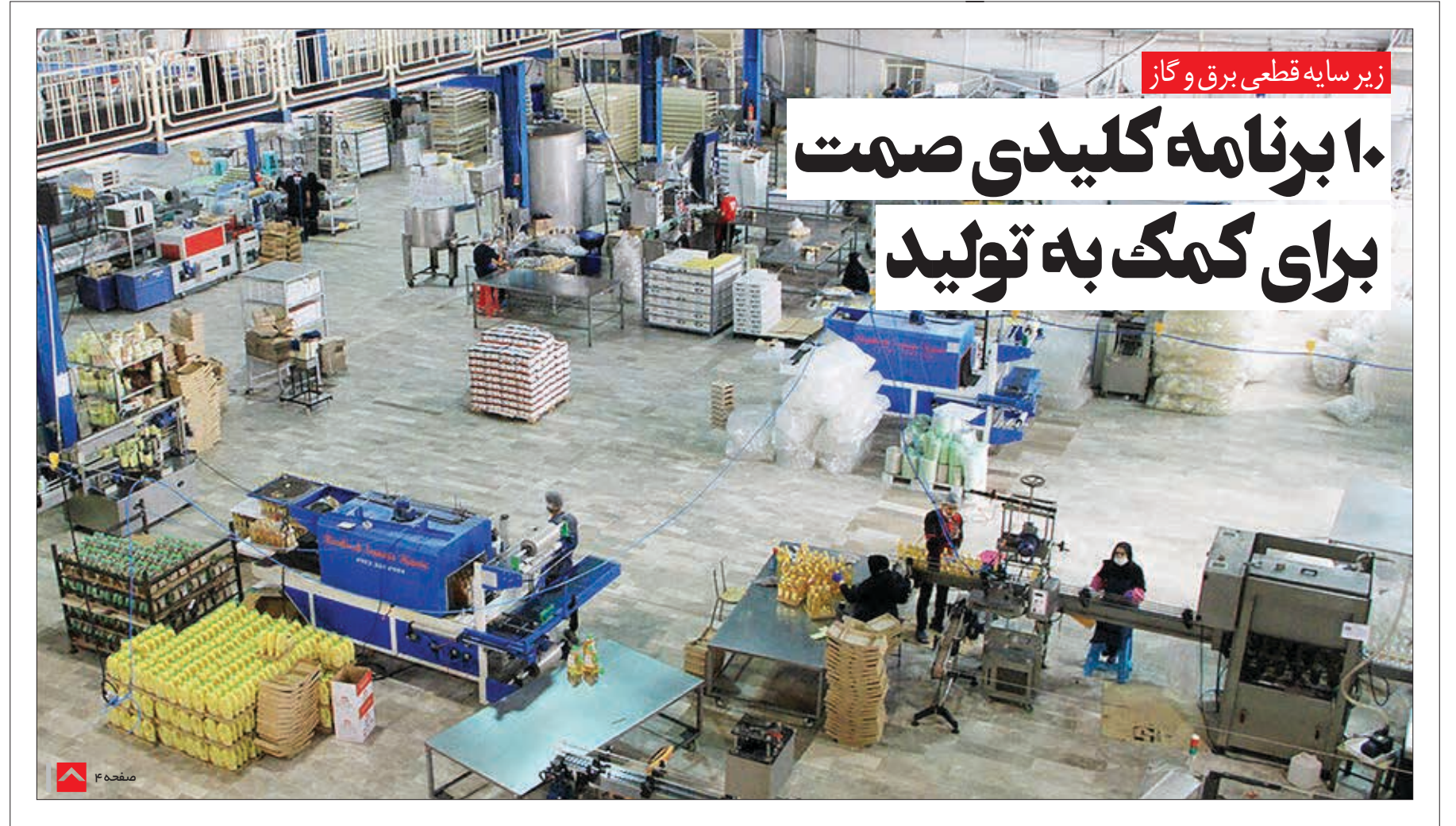
زیر سایه قطعی برق و گاز