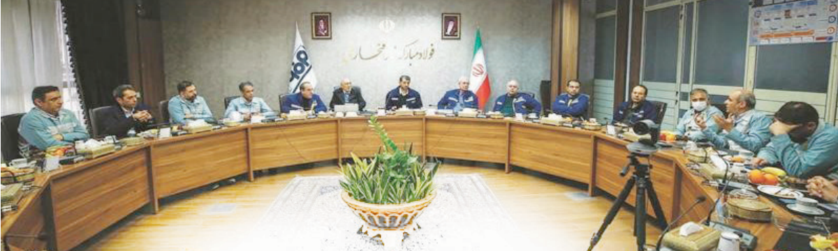
دستیار اجتماعی رئیس جمهوری در بازدید از شرکت فولاد مبارکه: