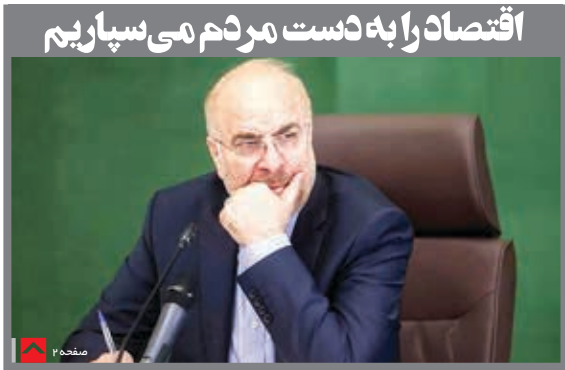
اقتصاد را به دست مردم می سپاریم

پیش بینی یک اقتصاددان از نرخ تورم در سال آینده