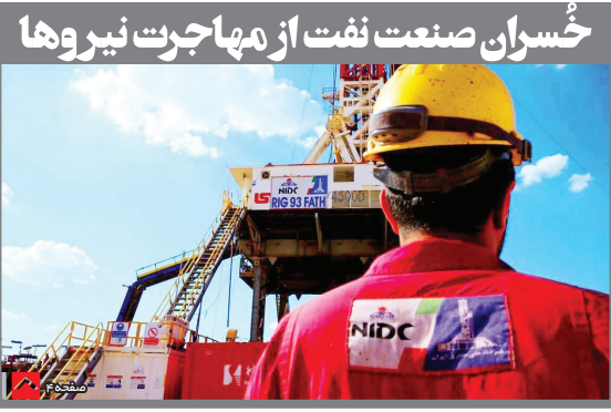
حُسران صنعت نفت از مهاجرت نیروها