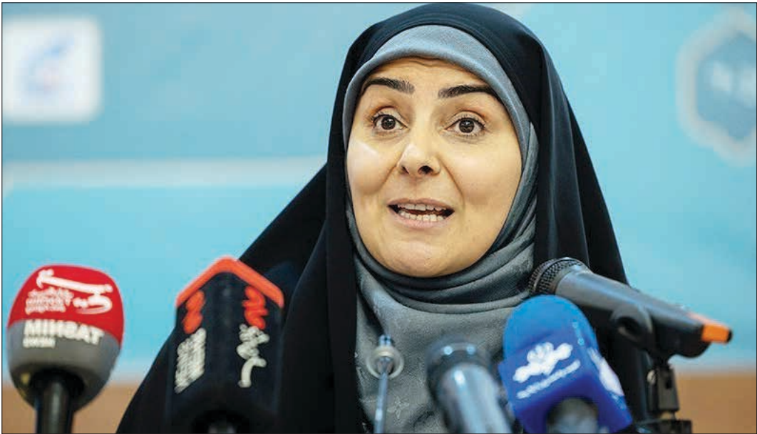
وزیر راه و شهرسازی

زمین به محدوده‌های الحاقی شهرها اضافه شده است.وزیر راه و شهرسازی یادآور شد: در خصوص مسدل دوم تامین زمین و بحث الحاقات، ذکر این نکته الزامی است که ما زمین‌هایی را به چرخه ساخت مسکن می‌آوریم که مشکلات تخصصی ساخت مسکن نداشته باشند، برای مثال دچار مشکل تصرف حقوقی نباشند یا روی حرایم هم‌زمان در اختیار مردم این سایت‌ها قرار گیرد و در این خصوص تعاملات بیشتر و متمر ثمر تر با وزارت نیرو نیز در دست انجام است.