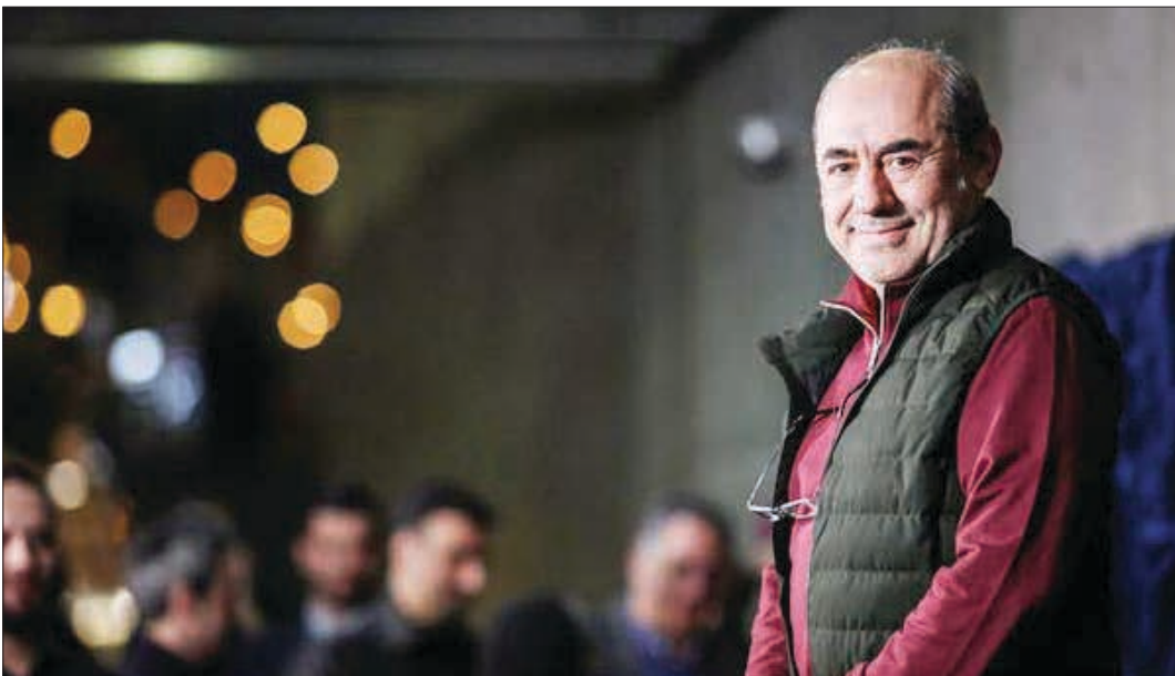
کمال تبریزی در جشنواره فیلم فجر ۱۳۹۶