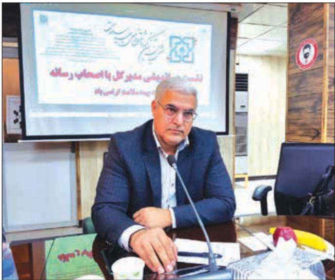
هفته سلامت، گفت:

مدیرکل بیمه سلامت خوزستان با اعلام اینکه حدود ۵۰ درصد جمعیت که عمدتاً در روستاها ساکن هستند، تحت پوشش داریم، عنوان کرد: قریب به ۲ میلیون و ۳۰۰ هزار نفر بیمه شده تحت پوشش داریم که یک میلیون و ۳۹۱ هزار نفر در روستاها، ۵۶۶ هزار نفر در قالب صندوق بیمه سلامت همگانی ایرانیان، ۲۵۰ هزار نفر در حوزه صندوق کارمندی و مابقی صندوق های