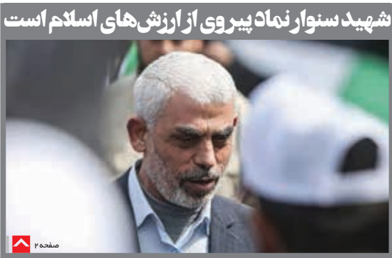
شهید سنوار نماینده پیروی از ارزش‌های اسلام است