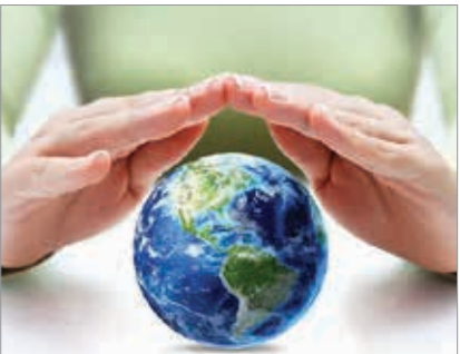
موفق بودند بماند. البته بررسی هانشان می دهد که در

راستای اقدامات انجام شده لایه ازن تا حد زیادی ترمیم شده است.