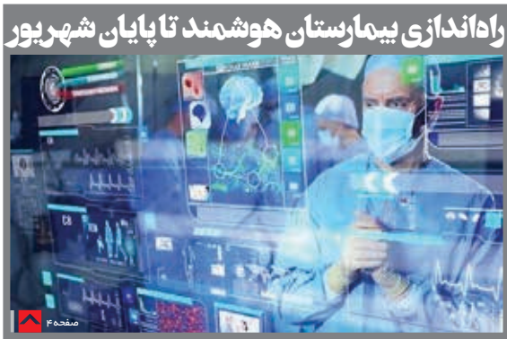
راداندازی بیمارستان هوشمند تا پایان شهریور

در نشست معاونان اول سه قوه مطرح شد رشد اقتصادی ۸ درصدی نیاز به همفکری قوای سه گانه دارد