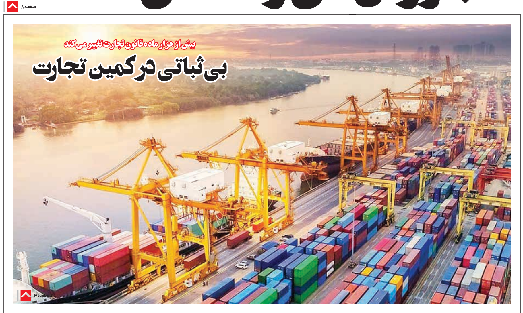
پیش از مهراز ماهه تا قریه تجارت تغییر می کند