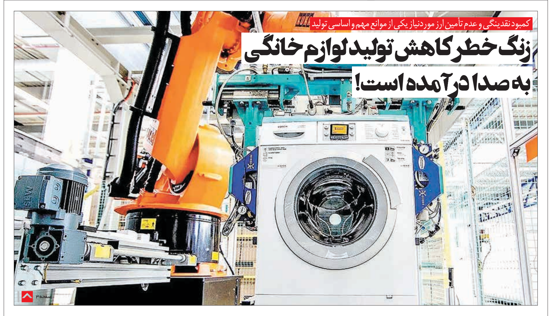
کمبود نقدینگی و عدم تأمین ارز مورد نیاز یکی از موانع مهم و اساسی تولید