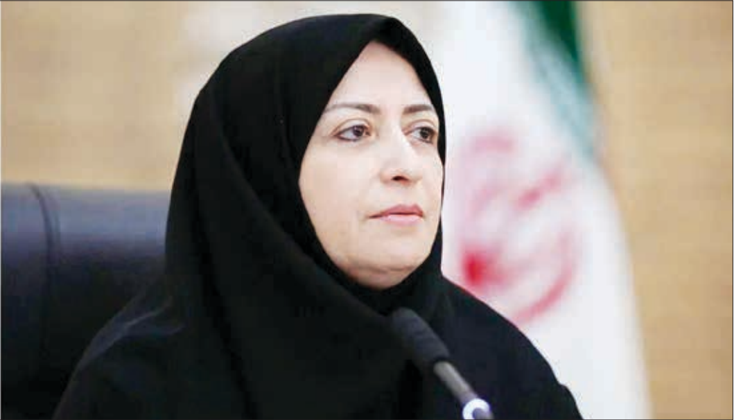
رئیس سازمان حفاظت محیط زیست