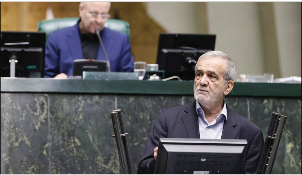
خربدار، رئیس‌جمهور گفت: