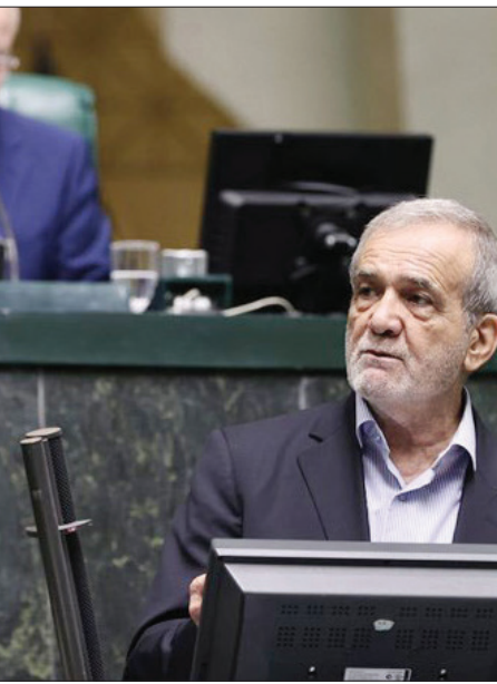
خربدار، رئیس‌جمهور گفت: