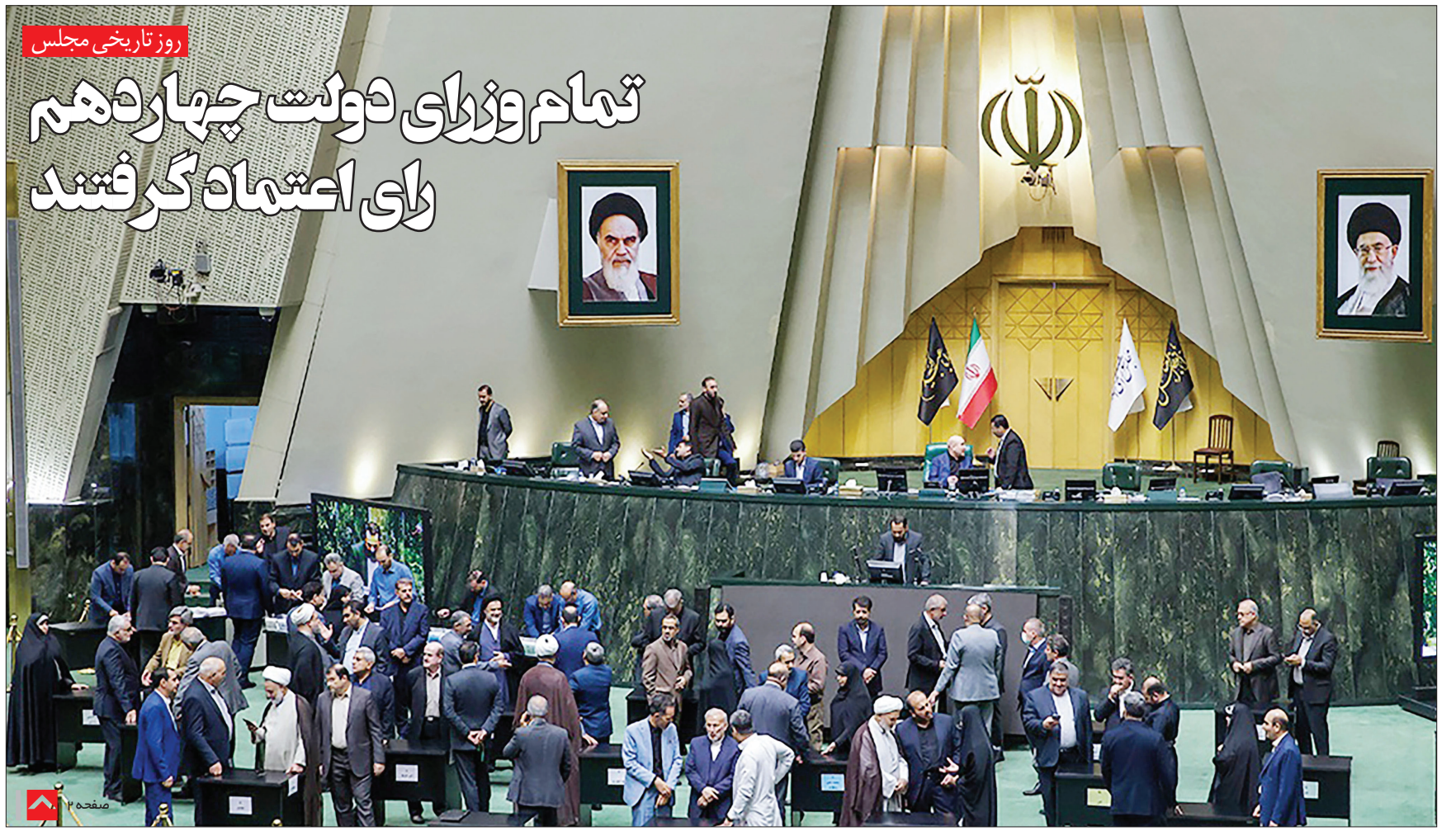
روز تاریخی مجلس