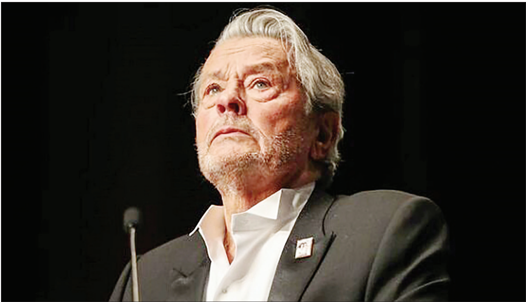
آلن دلون در جشنواره فیلم مارادونا