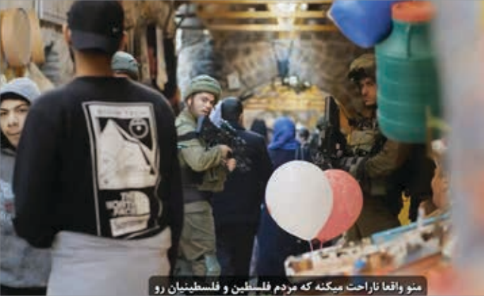
منو واقعاً ناراحت میکنه که مردم فلسطین و فلسطینیان رو

در مجموع کار فرهنگی‌ای که قرار است همه را ارضای نگه دارد معمولاً قدمی فراتر از آن بر نمی‌دارد. از چنین کاری نمی‌توان انتظار یک اثر ماندگار در عالم هنر را داشت.