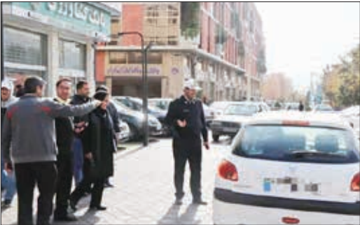
رئیس سازمان هواشناسی کشور

۲۳ تیرماه و بر اساس ابلاغ محمد مخبر، سرپرست وقت ریاست جمهوری، مبلغ جریمه‌های راهنمایی و رانندگی که از سال ۹۶ تاکنون تغییر نکرده بود، افزایش پیدا کرد و از این تاریخ به بعد تخلفات رانندگی با نرخ‌های جدید جریمه می‌شود. اقدامی که هدف از آن کاهش تصادفات و خساراتی جانی ناشی از آن و نیز افزایش نظم ترافیک عنوان شده‌است.تخلف «توقف و سد معبر در سطح یا حریم تقاطع‌ها و میدانی یا سطوح شطرنجی» در کلانشهرها، مراکز استان‌ها، جاده‌های بین شهری و مناطق آزاد تجاری - صنعتی، سایر شهرها و روستاها ۱۲۰ هزار تومان جریمه در پی دارد.مبلغ جریمه برای «هر نوع توقف که منجر به سد معبر و یا اختلال در عبور و مرور شود» که جزو تخلفات ساکن محسوب می‌شود در کلانشهرها، مراکز استان‌ها، جاده‌های بین شهری و مناطق آزاد تجاری - صنعتی ۹۰ هزار تومان تعیین شده‌ است. این تخلف در سایر شهرها و روستاها به ترتیب ۶۰ و ۳۰ هزار تومان جریمه در پی خواهد داشت.