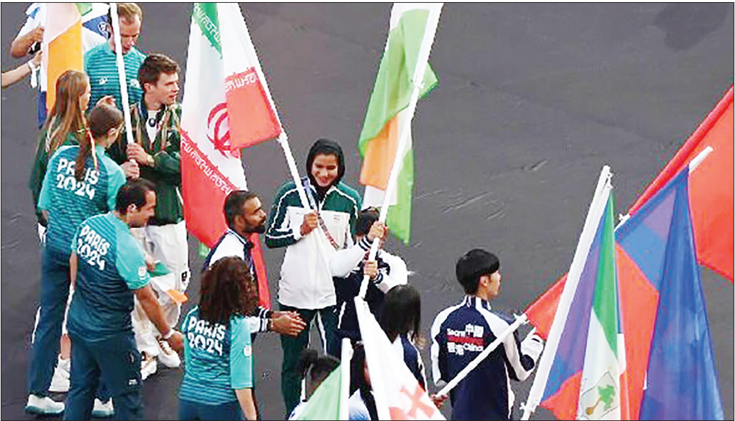
مراسم اهدای مدال به تیم ملی کشتی فرنگی