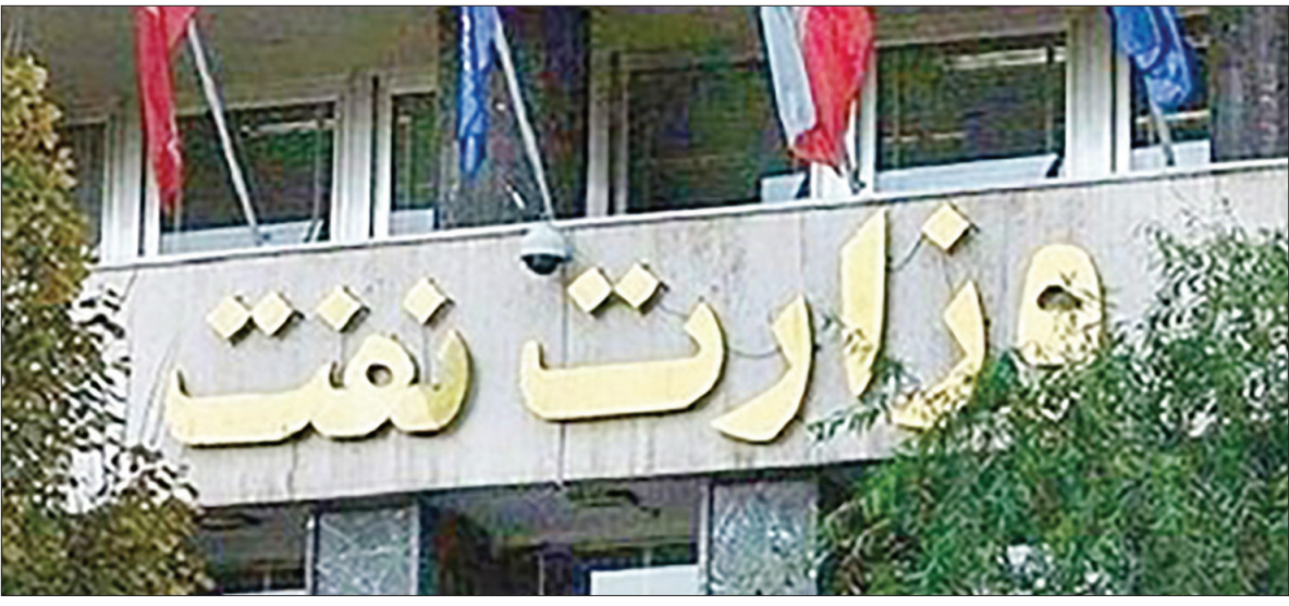
خریدار کد شمارش معکوس برای تعیین تکلیف

سکندار «بولدارترین و پولسازترین» وزارتخانه دولت آغاز شده است، و چشم‌ها به پاستور دوخته شده تا ببینند مسعود پزشکیان چه کسی را به عنوان وزیر پیشنهادی نفت به پارس‌ستان نشینان معرفی می‌کند. کلیدوزارت نفت به دست هر کسی که داده شود بی‌شک زوهای آرمی را نخواهد داشت، تحریم‌های سنگین بر فروش نفت ایران، نوسازی زیرساخت‌ها و پالایشگاه‌ها، رقابت‌های شدید در بازار نفت دنیا، بازیسی‌گیری جایگاه نفت‌ایران در عرصه جهانی، تقویت و تنظیم روابط با کشورهای تولیدکننده نفت و بهبود وضعیت ایران در میان کشورهای سیاست‌گذار نفتی و … تنها بخشی از چالش‌های پیش روی وزیر نفت آینده است. وزیری که مسئول تأمین بخش زیادی از هزینه‌ها و بار مالی دولت است.از سال ۱۳۵۷ تا دولت سیزدهم، ۱۰ چهره سکندار وزارت نفت بوده‌اند، نکته قابل تامل آن است که چهار وزیر در دو دوره ریاست جمهوری احمدی‌نژاد در این وزارتخانه مستقر شده‌اند که کاربایت از جایجایی‌های ریساد در این وزارتخانه در آن دوره‌ها دارد. دولت‌نهم ۲ وزیر نفت و دولت دهم نیز ۲ وزیر نفت به خوددیده، اما پایدارترین دوره مدیریتی در صنعت نفت ایران در سال‌های بعد از انقلاب، به دولت‌های هفتم و هشتم و همچنین یازدهم و دوازدهم، یعنی دولت‌های خامسی و روحانی، تعلق دارد. در این ۱۰سال، بیژن نامدار زنگنه مسئولیت و مدیریت وزارت نفت را بر عهده داشت.