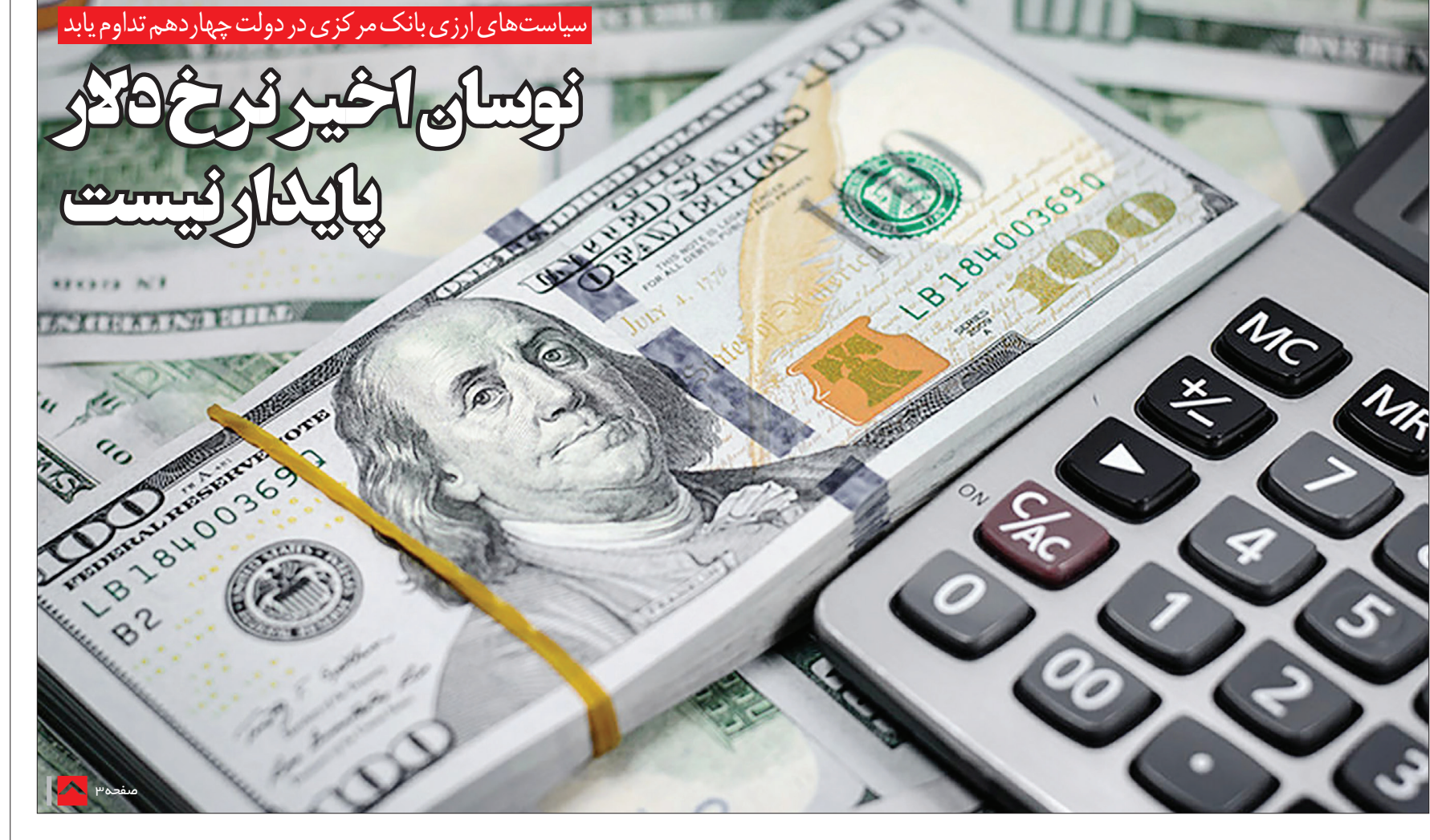
سیاست‌های ارزی بانک مرکزی در دولت چهاردهم تداوم یابد

فلسفی گفت: کشاورز به منابع مالی حاصل از فروش محصولات کشاورزی نیاز دارد و برای سال آینده برنامه‌ریزی می‌کند و اگر پولش به موقع پرداخت نشود همه زندگی وی مختل می‌شود از طرفی برنامه‌ریزی او برای سال زراعی بعد هم دچار اشکال می‌شود و ما باید شرایطی را برای پرداخت مطالبات گندم کاران پیش‌بینی کنیم و در صورت تأخیر ضرر و زیان آن‌ها پرداخت شود.