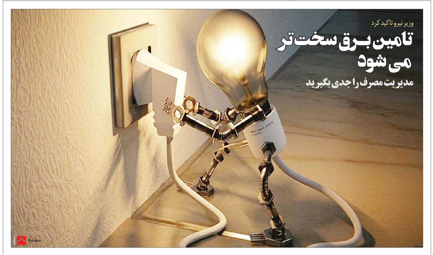
وزیر نیرو تاکید کرد