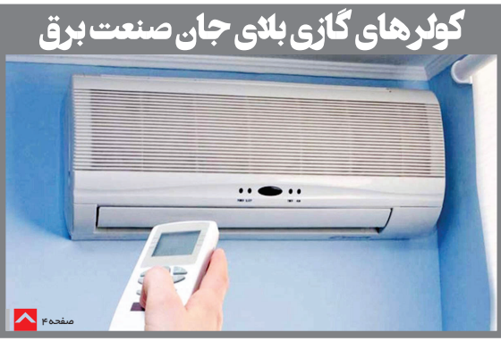
کولرهای گازی برای جان صنعت برق

در جلسه هیات دولت مطرح شد تاکید مخبر بر تامین منابع برای تکمیل مصوبات سفرهای استانی