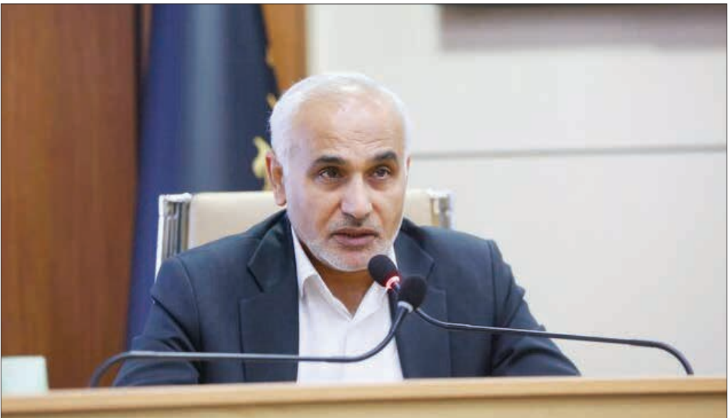
وزیر بهداشت و درمان: