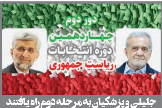
جلیلی و پزشکیان به مرحله دوم راه یافتند

وزیر کشور: مرحله اول انتخابات ریاست جمهوری با امنیت و سلامت کامل برگزار شد