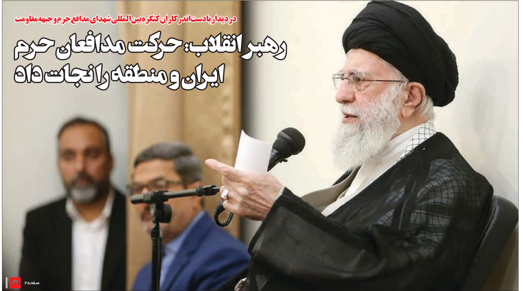
در دیدار با دست اندرکاران کنگره بین المللی شهدای مدافع حرم و جبهه مقاومت