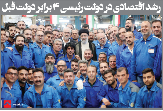
رشد اقتصادی در دولت رئیسی ۴ برابر دولت قبل