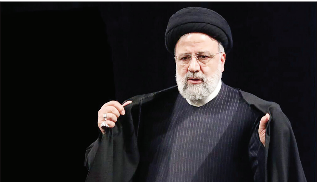
آیت‌الله‌عظمی سیدعلی خامنه‌ای

همچنین هزینه‌های مصرف نهایی بخش دولتی در سال ۱۴۰۲ نسبت به سال قبل از آن، کاهش ۱.۷ درصدی را تجربه کرده است.