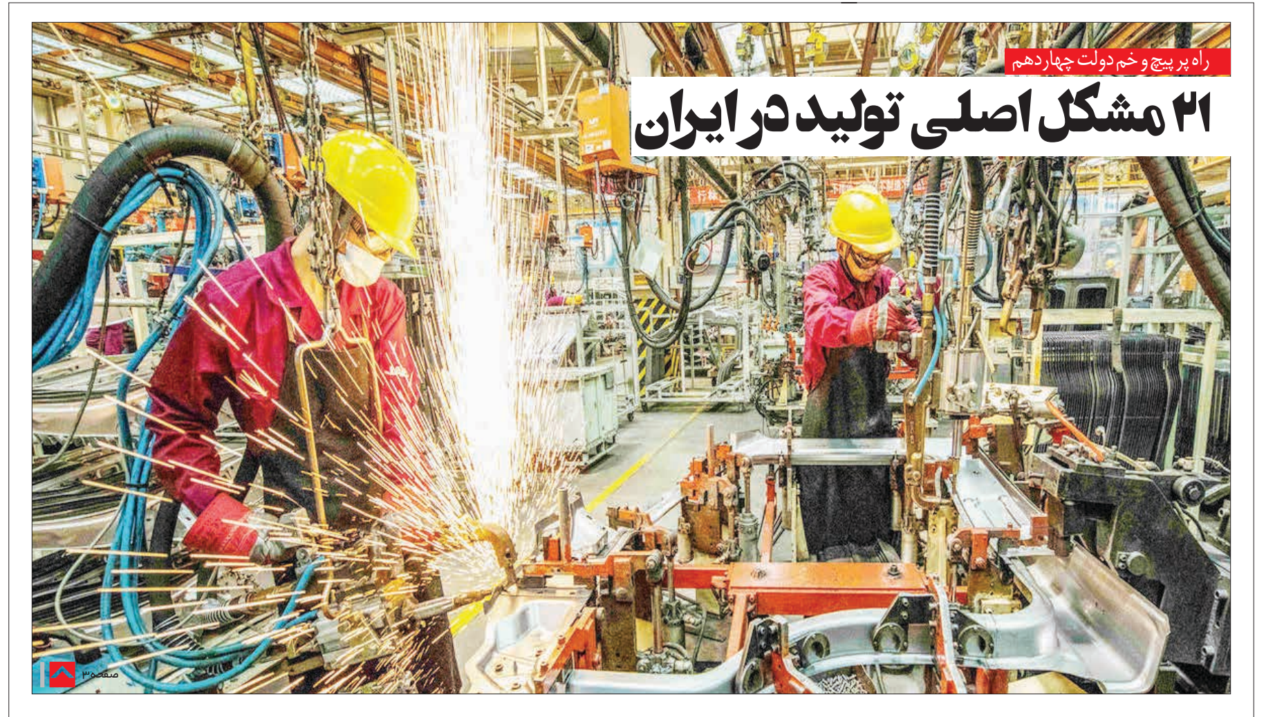
راه پر پیچ و خم دولت چهاردهم