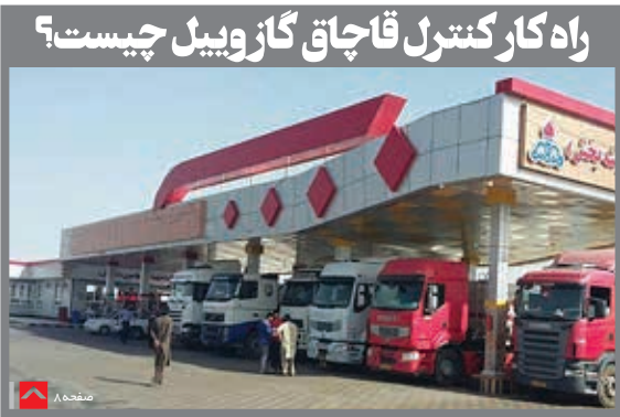
راه کار کنترل قاچاق گاز ویل چیست؟

از اجرای FATF داخلی گرفته تا واگذاری تمامی بنگاه های دولتی!