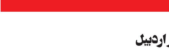
مدیرکل آموزش فنی و حرفه‌ای استان خیرباد: