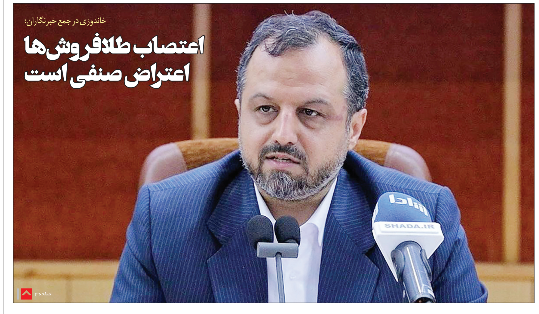
خاندوزی در جمع خبرنگاران: