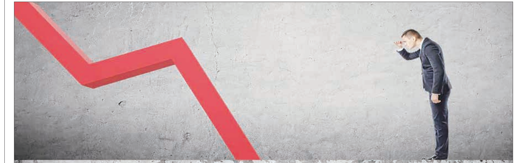
چرا گاهی رکود در بازار سرمایه سنگین می شود؟