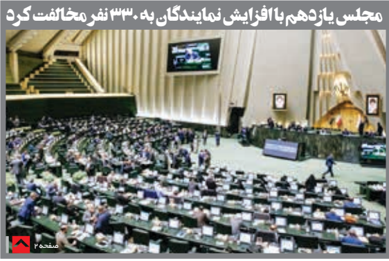
مجلس یازدهم با افزایش نمایندگان به ۳۳۳ نفر مخالفت کرد