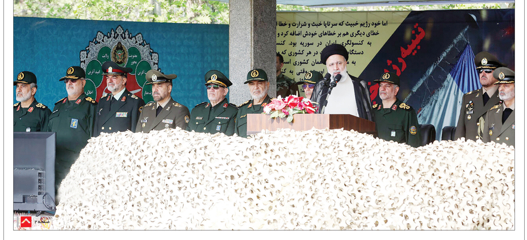
امروز دیگر سخن از گزینه نظامی علیه ملت ایران نیست

تولید سالیانه فولاد ایران از مرز ۳۲ میلیون تن گذشت مربوط به تولید شمش فولادی است که رشد ۹.۲ درصد نسبت به سال پیش دارد.