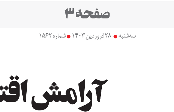
تقاضای واقعی ارز است که سمت عرضه آن از