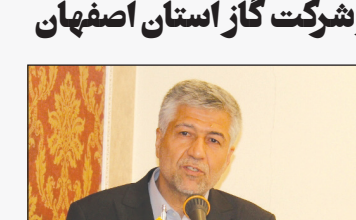
طی سال ۱۴۰۲ انجام شد

اصفهان-مریم مومنی < در راستای تکریم مراجعین و پاسخگویی به درخواستهای مردم شریف استان، تعداد ۴۵۴ مورد دیدار چهره به چهره مدیرعامل شرکت گاز استان اصفهان با هم استانی‌ها طی سال ۱۴۰۲ برگزار شد.