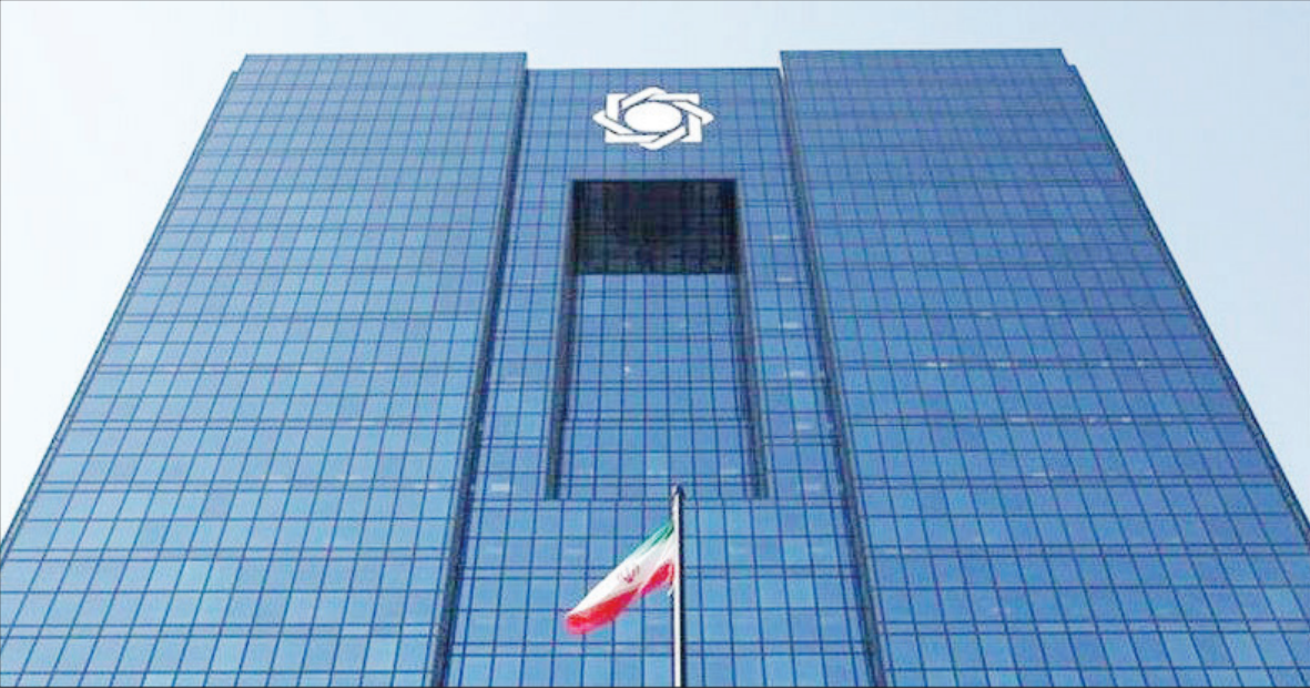
مرکز خرید راد، مدیر اداره اعتبارات بانک مرکزی از

افزایش اعتبار گواهی سپرده خاص و عام وی از افزایش اعتبار «گواهی سپرده عام و خاص» برای تامین مالی بخش تولید در سال جاری خبر داد و تصریح کرد: سال گذشته در این زمینه ۲ هزار و ۴۰۰ همت مجوز برای شبکه بانکی داده شده بود که این رقم در سال جاری افزایش پیدا خواهد کرد ضمن اینکه با صدور مجوزهای لازم بهره‌گیری از این شیوه نامه مالی تسهیل خواهد شد.