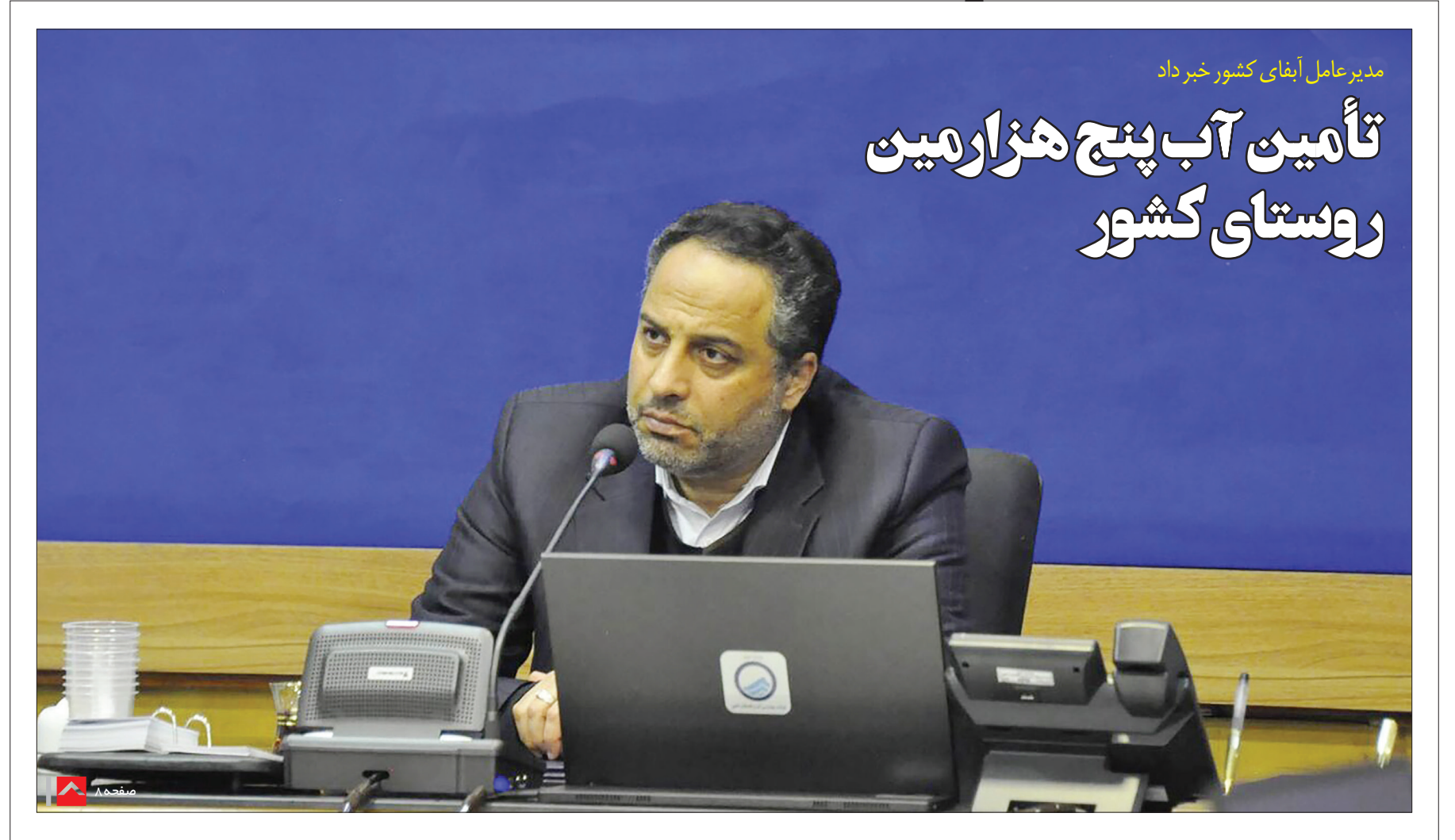
مدیر عامل آبفای کشور خبر داد